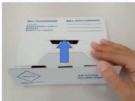
⑤手前の翼を反対側のすき間に差し込んで 蓋を閉じます。

蓋を閉めた時に、輸送ボックスに浮きが無いか確認してください。浮きがあると高さが30 mmを超えてしまい、郵送料金が高くなる場合があります。