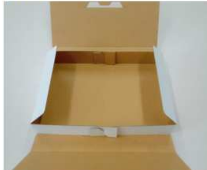
④残りの部分が蓋となるため、返送する 検体を入れてください。