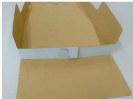
③羽の先にある爪同士を引っかけます。 反対側も同じように組み立ててください。