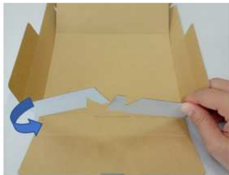
②立たせた両側にある羽を内側へ折り込みます。